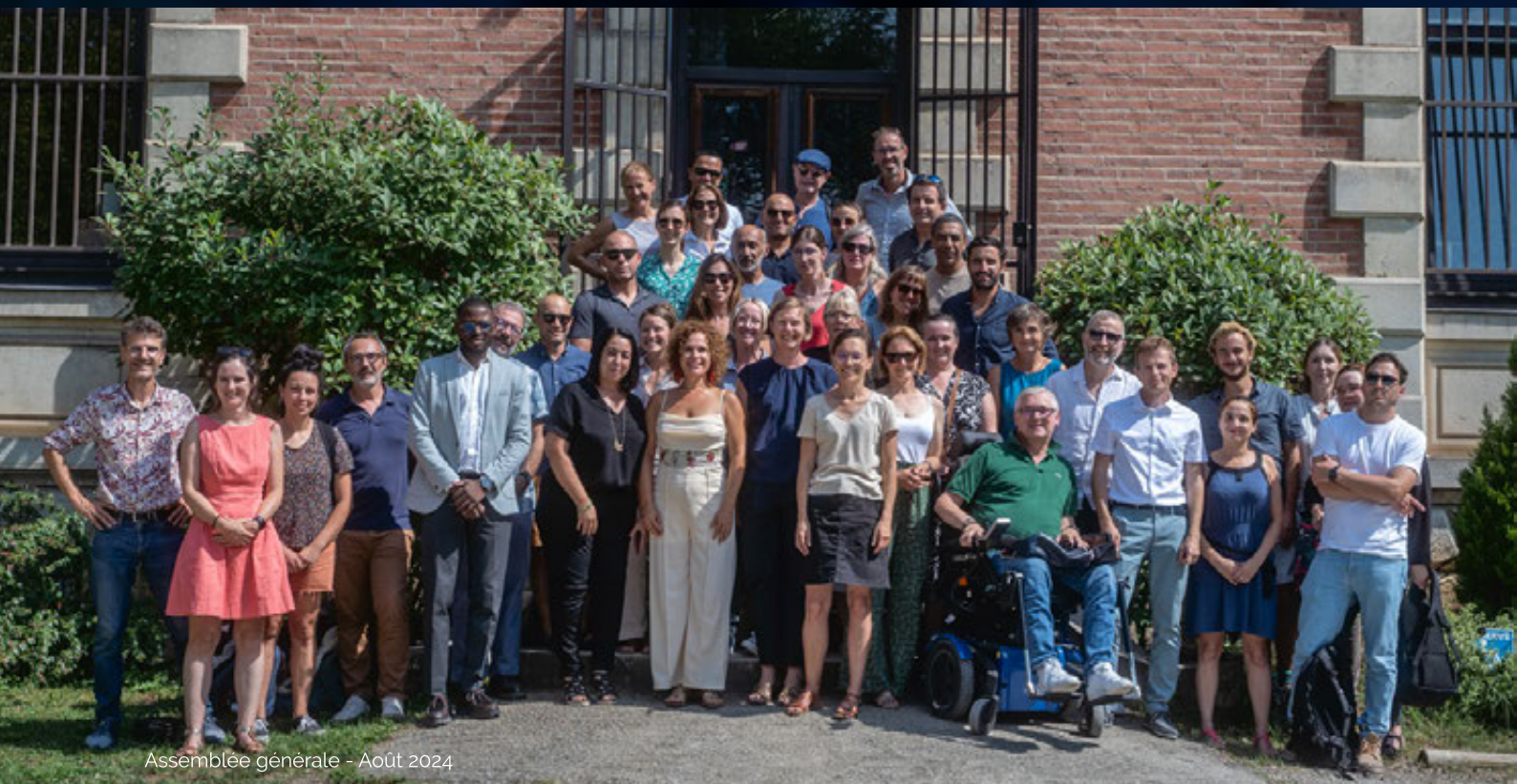
Assemblée générale - Août 2024